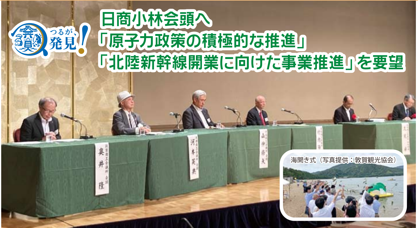
海開き式