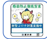
感染防止徹底宣言店